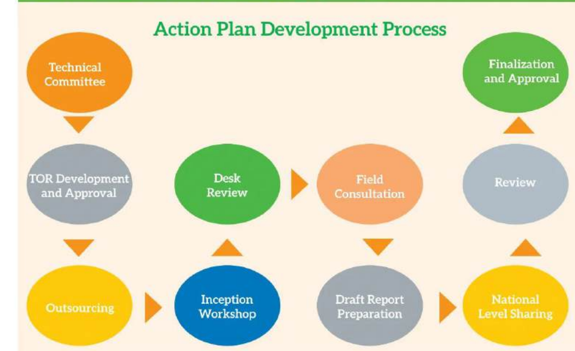
Figure 1: The process followed in the preparation of the action plan

Dolphin Conservation Action Plan (2021-2025)